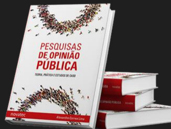
PESQUISA DE OPINIÃO PÚBLICA