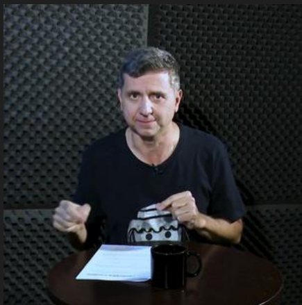
APRESENTADOR NA TV UNIFATEA