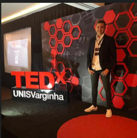
PALESTRA NO TEDX